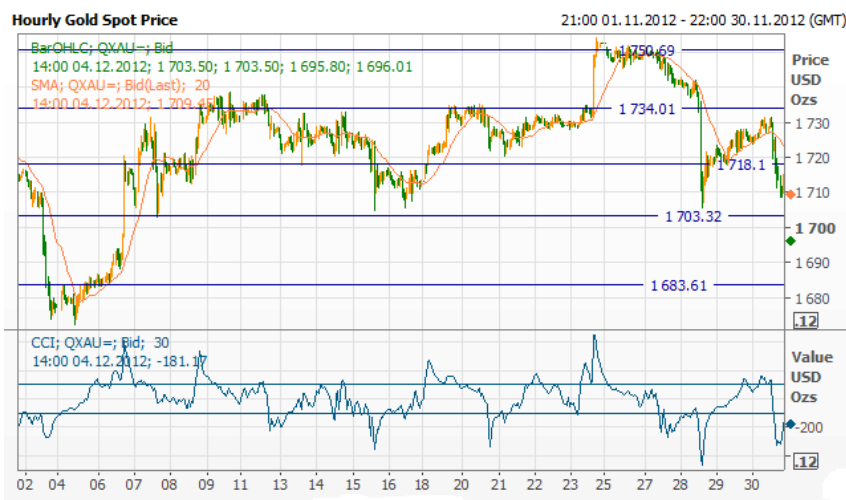
ДИНАМИКА ЦЕНЫ НА ЗОЛОТО В НОЯБРЕ 2012 Г.